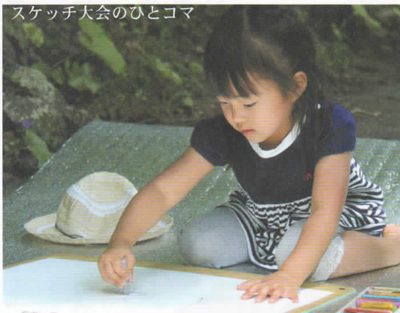
スケッチ大会のひとコマ

新春には、「八面山書道大会」も開かれる。山は、ただそこにあるというだけで、里人にとっての“文化”や“情報”の発信源となる…。