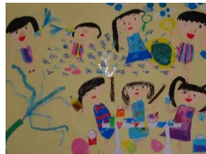
おみせやさんごっこ 製作遊び・水遊びなど