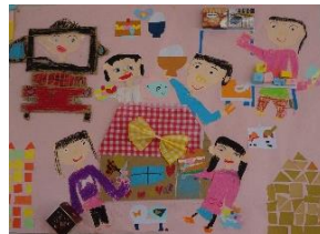
おうちごっこ・劇遊 び・砂場遊びなど