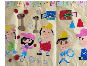
うんどうかいごっこ・ 忍者の修業など