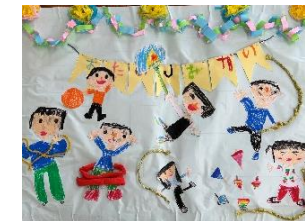
お楽しみ会・ドッチ ボール・なわとびなど