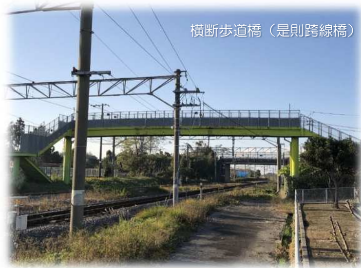
横断歩道橋（是則跨線橋）