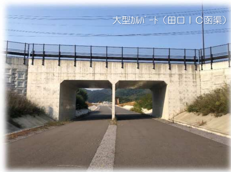
大型加幅橋（田口IC函渠）