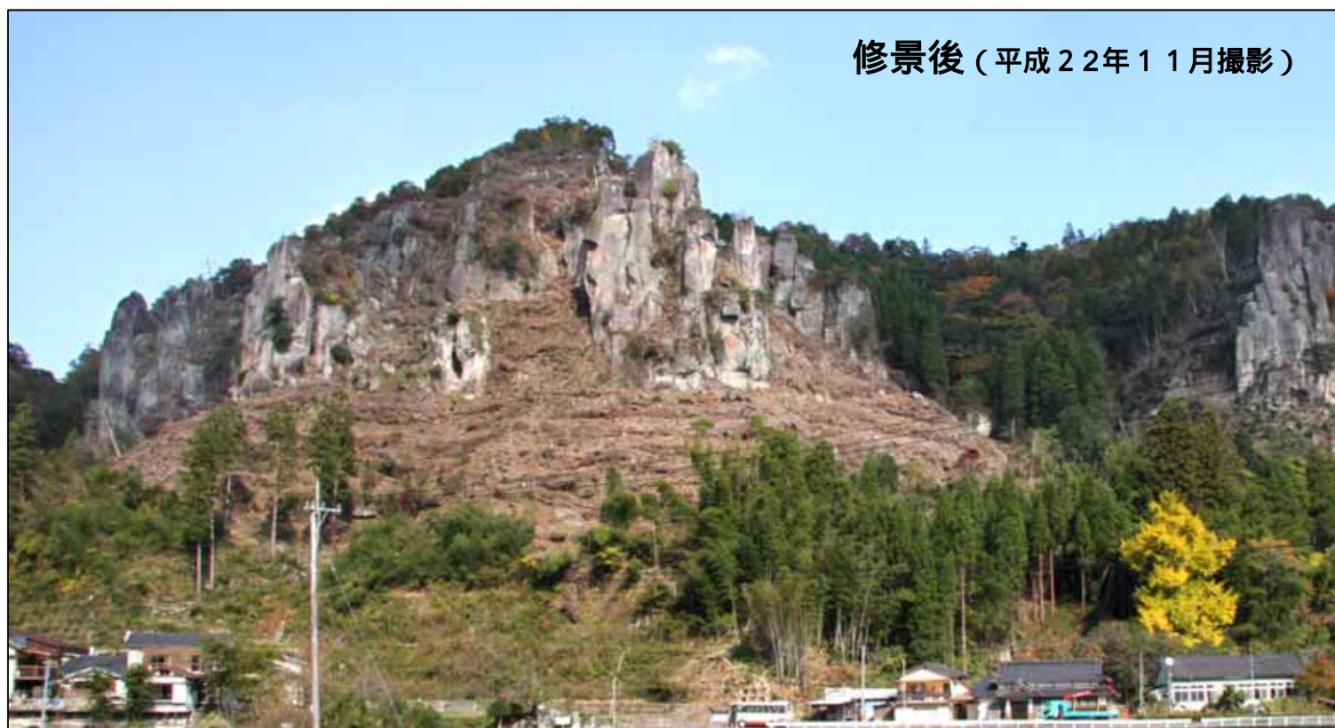
修景後（平成22年11月撮影）