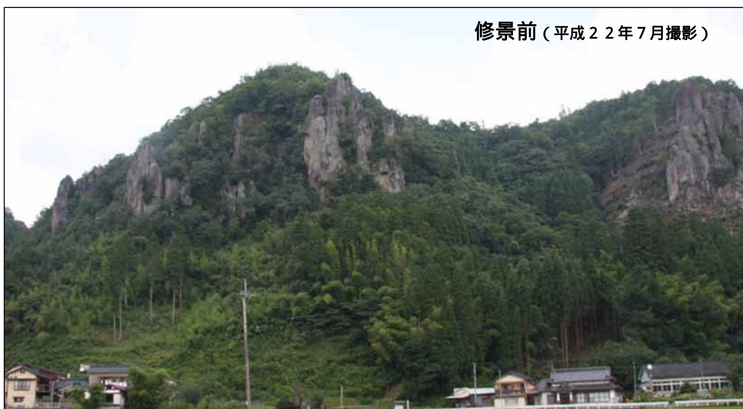
修景前（平成22年7月撮影）