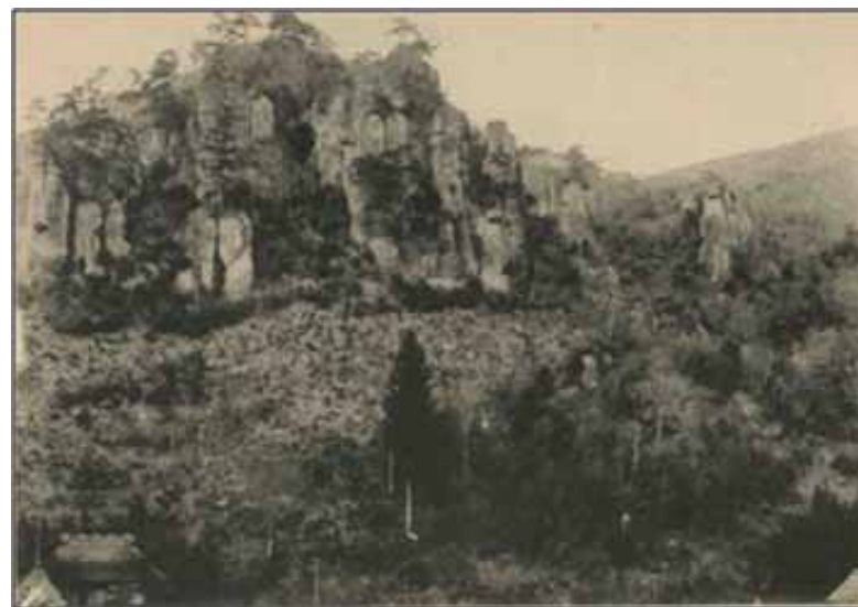
大正期の伊福の景（「裏耶馬溪寫真帳」より）

この度、地元住民のみなさんのご協力と地権者の方々のご理解をいただき、「名勝耶馬溪」の修景が実施され、指定当時の姿を再生することができました。