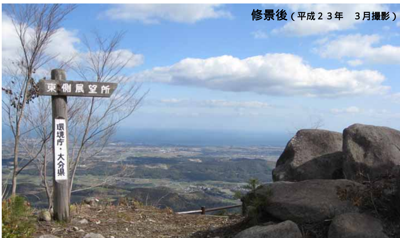
修景後（平成23年3月撮影）