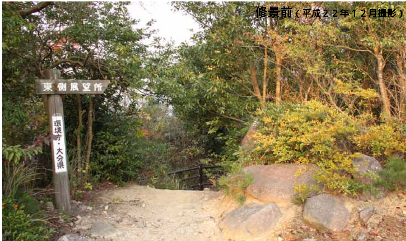
修景前（平成22年12月撮影）