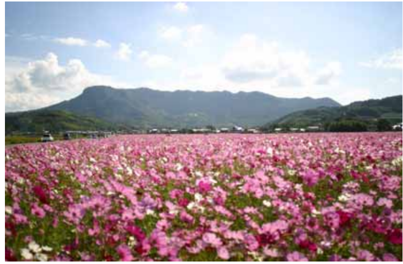
三光コスモス園から望む八面山

耶馬溪の奇岩・秀峰による独特の渓谷は、その美しさから大正12年3月7日に「名勝耶馬溪」として国の名勝（文化財）の指定を受けました。しかし、近年は、指定からかなりの年数が経過していることに加え、管理の難しさから木々が伸び過ぎてしまい、名勝として指定された当時の良好な景観が損なわれていました。この度、地元住民のみなさんのご協力と地権者の方々のご理解をいただき、「名勝耶馬溪」の修景が実施され、指定当時の姿を再生することができました。