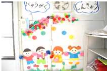
(おめでとう壁掛け)