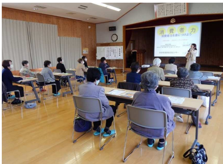
消費生活啓発講座

※新型コロナウイルス感染症の影響により講座開催依頼が少なくなっていることを踏まえ、現状維持の目標値としています。