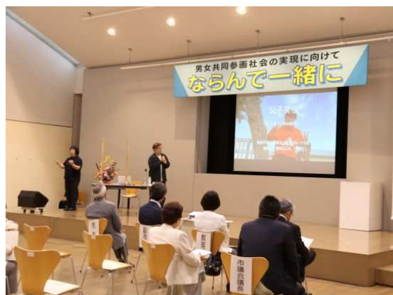
男女共同参画週間記念講演会