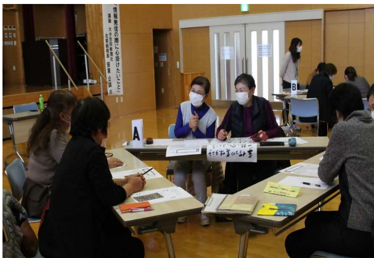
ボランティア講座