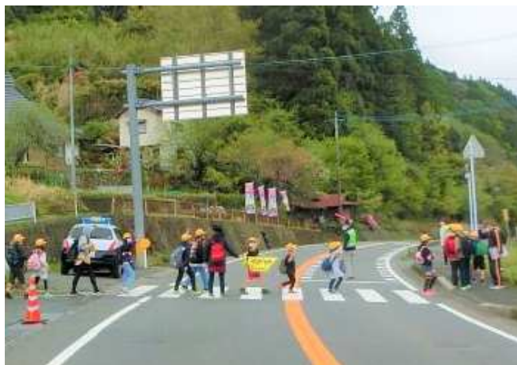
中津市安心パトロール隊による見守り活動