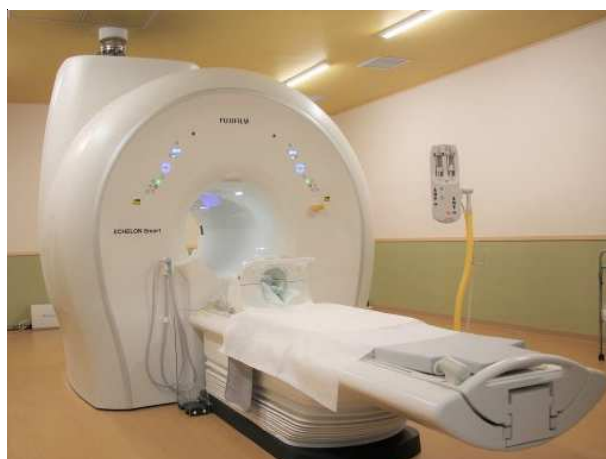
MRI(磁気共鳴画像装置)