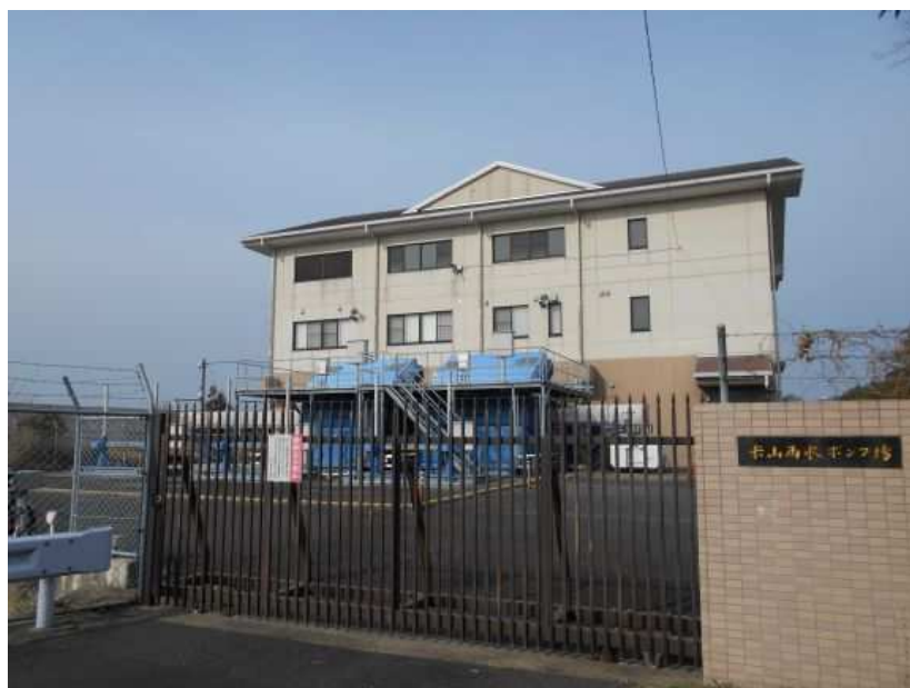
内水排除対策の推進(雨水ポンプ場)