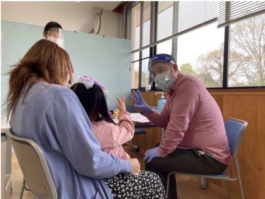
乳幼児健診(3 歳 6 か月児)