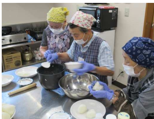
シニアほっと元気 station よりあ