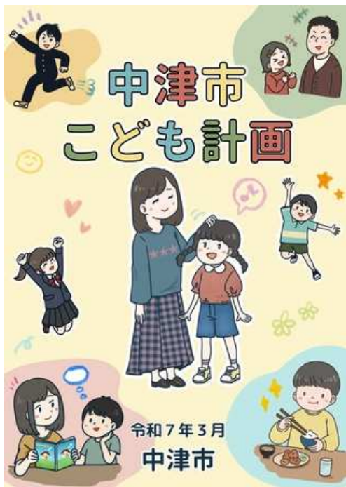
中津市こども計画