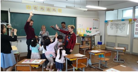
英語フェスティバル①