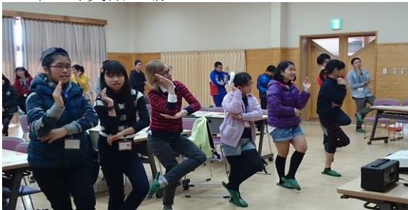
わくわく英語広場