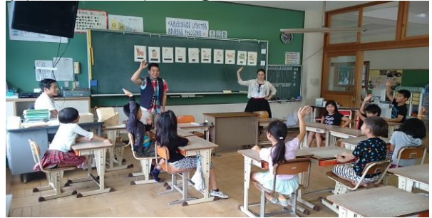
英語フェスティバル②