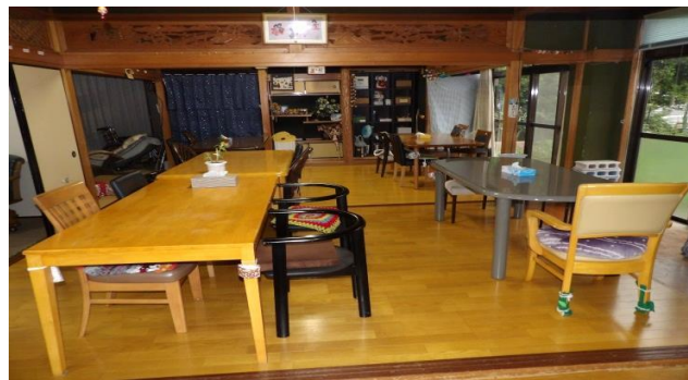
デイサービスフロア