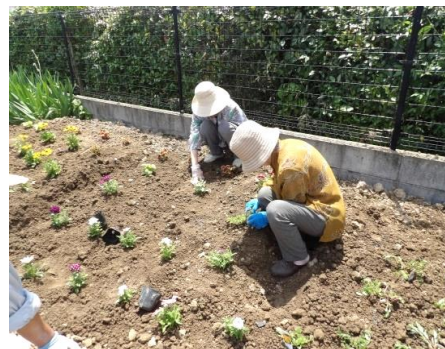
園芸作業・畑作り