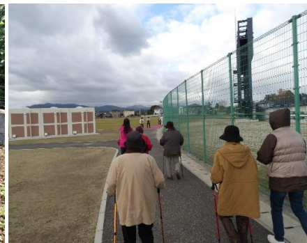
ふれあいウォーク(イベント)