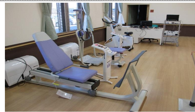
運動療法（パワー機器）