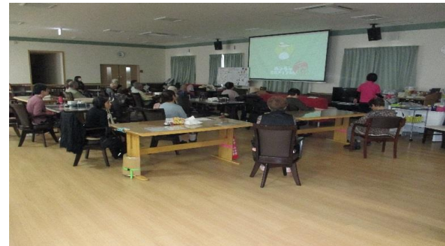
めじろん体操の様子