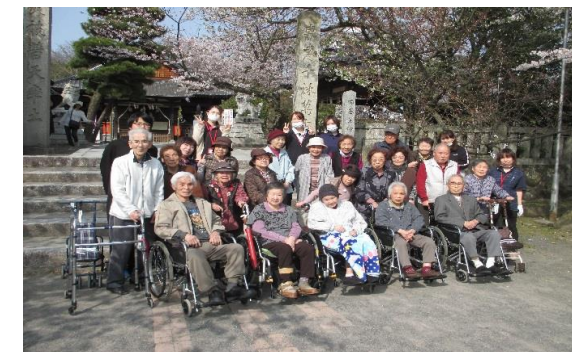
機能訓練を兼ねた外出行事