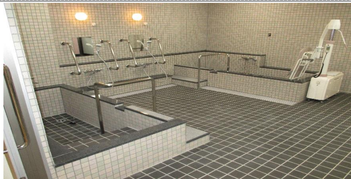
身体状況に合わせた入浴