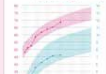
乳児身体発育曲線