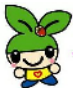
森林づくりマスコット キャラクター もりりん

森林の種類によって手続きが違います。 伐採する前にまず県振興局・市町村または森林組合で確認してください。