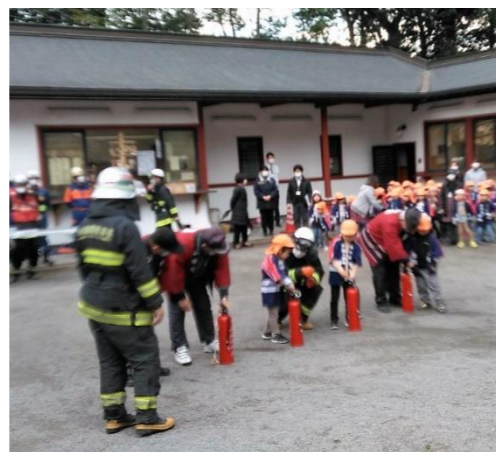
【大幡幼稚園園児による消火器訓練】