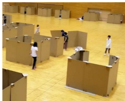
【段ボールのパーティション組立て】

また、後日我々の活動に対して、「快適に眠れる施設の用意や、親切な声掛け等で安心した」とのお礼のあいさつ状が送られて来たこと聞き、我々防災士の苦勞が報われたと嬉しく思いました。