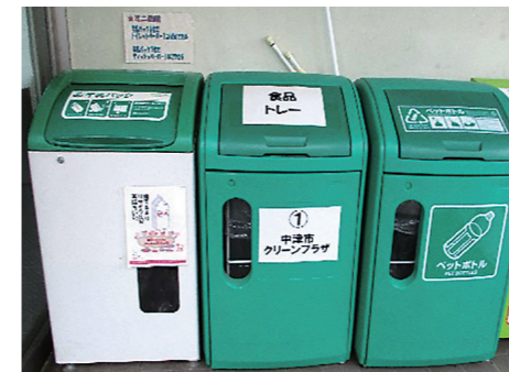
食品トレイ、牛乳パック エコステーション

中津市クリーンプラザでは、「資源ごみ」の一部を回収ボックス(ミニエコステーション)により拠点回収しています。「資源ごみ」には、「食品トレイ」、「牛乳パック」、「ペットボトル」、「小型家電」などがあり、それぞれの回収ボックスを設置しています。設置場所は、協力を頂いているスーパーや公共施設等に設置しています。新たに回収ボックス(ミニエコステーション)の設置を希望するお店(団体)又は施設管理者がいましたら、中津市クリーンプラザ(清掃管理課)までお問い合わせください。