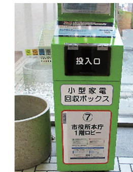
小型家電 回収ボックス