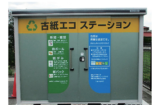
古紙 エコステーション