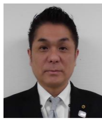
新居委員 (委員長職務代理者)