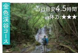
山行目安4.5時間 体力★★★

八面山を満喫できるロングコース 山上の大池から流れる水が幾重もの滝をなす美しい渓谷沿いのコース。途中の鳴子台からは中津市街を望む。やや荒れている箇所もあるため、初心者だけの入山は避けよう。