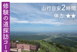
山行目安2時間 体力★★

八面山を満喫できるロングコース 山上の大池から流れる水が幾重もの滝をなす美しい渓谷沿いのコース。途中の鳴子台からは中津市街を望む。やや荒れている箇所もあるため、初心者だけの入山は避けよう。