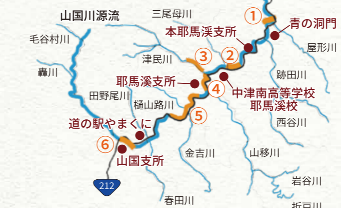
【山国川流域鮎の友釣り専用区間地図】