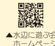
▲水辺に遊ぶ会ホームページ