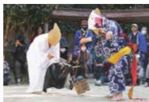
御田植式の代掻き

から始まり、当日は「お下り」、法要の後、ホラ貝の響きを合図に雑刀を持った白装束の僧兵を先頭に3基の神輿が下宮から本堂へ駆けあがる「お上り」、最後に多くの客を前に五穀豊穡を祈る「御田植式」となります。この儀式「水止め」から「種時き」まで稲作の一連作業を、山麓の信者たちが白装束・草鞋履きに、編み笠を深くかぶり、古式にのっとり演じます。神輿前での作法の後には、観客とのユーモアたっぷりのかけ合いや所作あり。例えば、「代掻き」では牛引き役が暴れ牛に手を焼き、飼葉桶を持った妊婦が登場、餌を与えるなど熱演が続きます。会場大爆笑。 ふと、幼い頃の田植え作業を思い出しました。当時、農家は牛馬を飼って農作業を行っていました。田を鋤で粗起こし後使う農具に「飛行機モーガ」がありました。その名のとおり、翼状に両開きする木製枠に多くの刃が下向きに伸びた農具で、牛馬に引かせて土塊を細かく切り崩し田を平らにします。これに子どもが乗ると適当な重みがかかり効果が増します。牛馬に蹴られはしないかと少し怖いのですが、子どもには楽しい手伝いになります。昭和30年代前半までの田植えは、7百年前の松原マツとあまり変わらず、牛馬や人力が頼りでした。となると、この60年余の間に農業の機械化が大きく進んだこととなります。 名人芸の牛引き演者このかけ合い、「代掻きは重労働、トラクターがほしい」との要望に、「エアコン付きを買いますよ」と笑顔で応じました。でも真無形民俗文化財の「松原マツ」、やっぱり牛の方がいいですね。