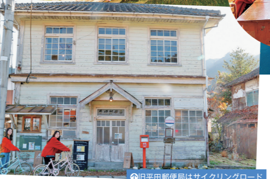
⑩旧平田郵便局はサイクリングロードのすぐそばに立つ