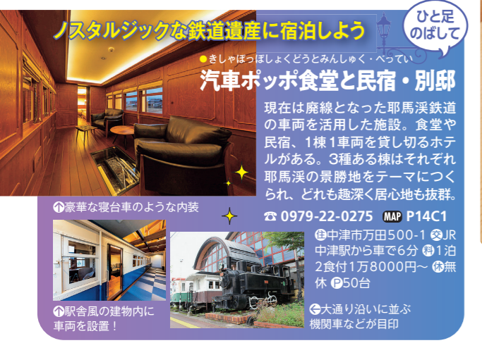
⑥豪華な寝台車のような内装 ⑦駅舎風の建物内に車両を設置!