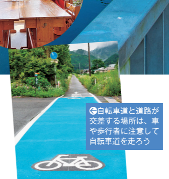
⑪自転車道と道路が交差する場所は、車や歩行者に注意して自転車道を行こう