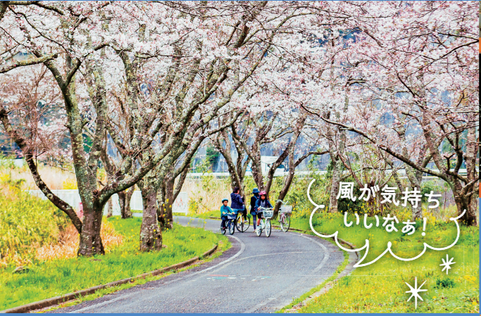
③季節ごとに化する耶馬溪の自然を楽しもう