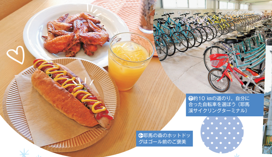
⑧約10kmの道のり、自分に合った自転車を選ぼう(耶馬溪サイクリングターミナル) ⑨耶馬の森のホットドッグはゴール前のご褒美