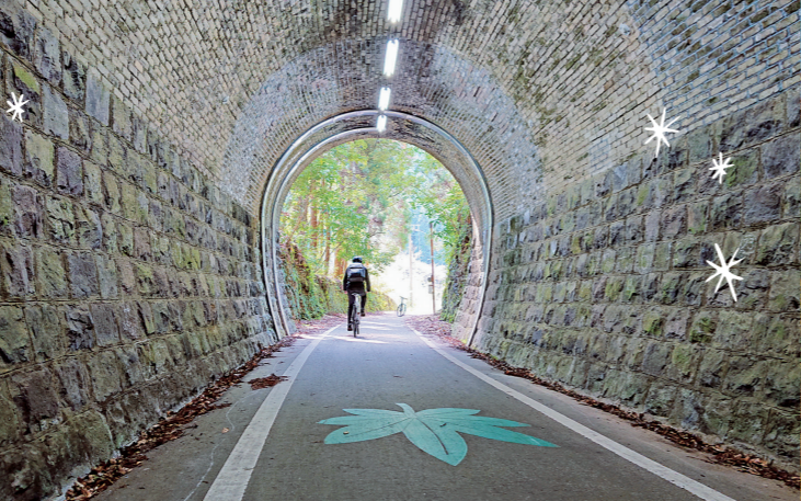
②「城井トンネル」(MAP P14C2)など美しい鉄道遺構が多数

かつての鉄道橋を利用した、カーブが珍しい第二山国川橋 JR 中津駅から山国へと続くメイプル耶馬サイクリングロードは、耶馬溪鉄道の廃線跡を利用して昭和57年(1982)に整備された自転車道。レンタサイクルで走ってみよう!