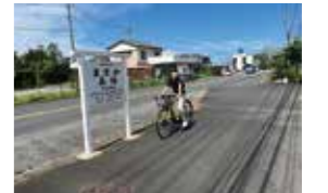
▲旧真坂駅の駅看板