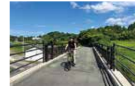
▲旧野路駅近くの歩道橋

7月梅雨前線による豪雨の影響で、メイプル耶馬サイクリングロードの一部は、現在復旧工事のため通行止めとなっています。復旧状況などについては、市報なかつや市ホームページなどで発信する予定です。なお、表の区間を除くサイクリングロードは通行が可能です。旧市内や三光エリアにおいても、旧耶馬溪鉄道の跡地や素晴らしい景観の中でサイクリングを楽しむことができます。通行の際は十分に気を付けてください。