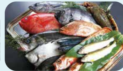
※画像はすべてイメージです。