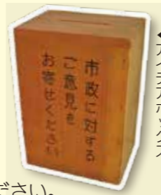
▲アイデアボックス

アイデアボックス横に備え付けている用紙に、住所、氏名、電話番号、意見・要望・提言などを書いて投函してください。