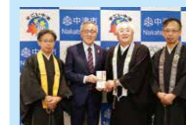
◀中津仏教会より市政振興のために10万円を寄付 (12/8)