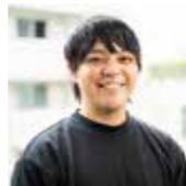
福山 敦士氏 (連続起業家、ビジネス教育研究家)