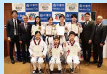
◀大分県テコンドー協会中津支部のみなさんがJOCジュニアオリンピックカップ第16回全日本ジュニアテコンドー選手権大会の結果を報告 (12/21)