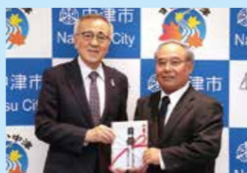
◀昭和43年度中津中学校卒業生同窓会より市政振興のために52,000円を寄付 (12/21)