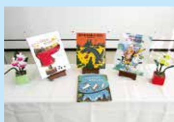
◀中津少年学院の院生より図書館に点字翻訳絵本4冊を寄付 (12/22)