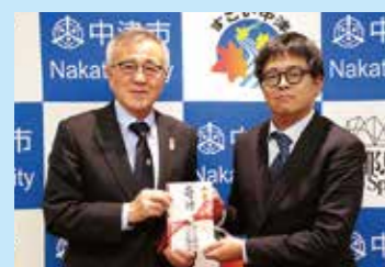
◀(株)マルシン漁具より日本赤十字社の活動支援のため50万円を寄付 (12/18)