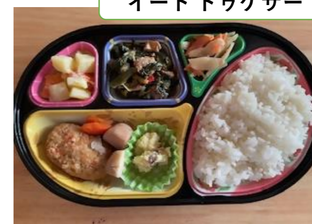
イートトゥゲザー