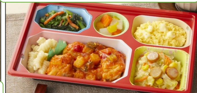
宅配クック 健康ボリューム食