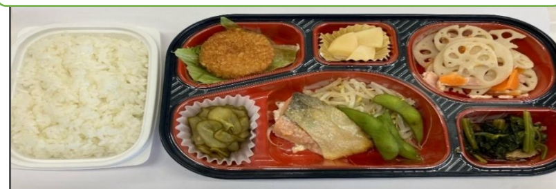
日田ダイナー カロリータンパク調整