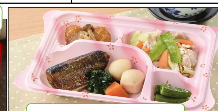
宅配クック 透析食