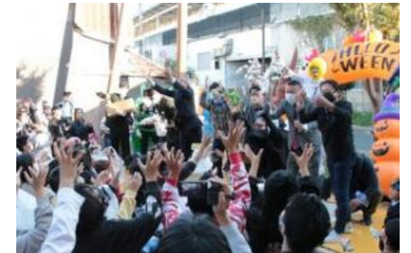
商店街でのイベントでの賑わい