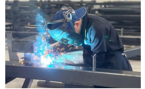
活躍するものづくり企業