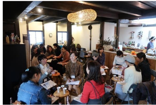
女性起業家支援事業 交流会