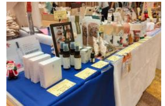
6次産業による商品開発と販売促進