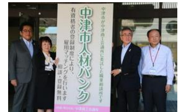
中津市人材バンクの開設