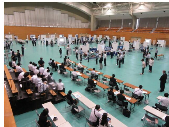
企業合同就職説明会