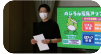
▲専門職が説明する様子