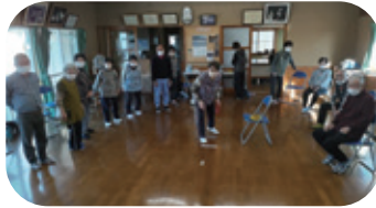
▲レクリエーション