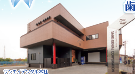
サンエイデンタル本社