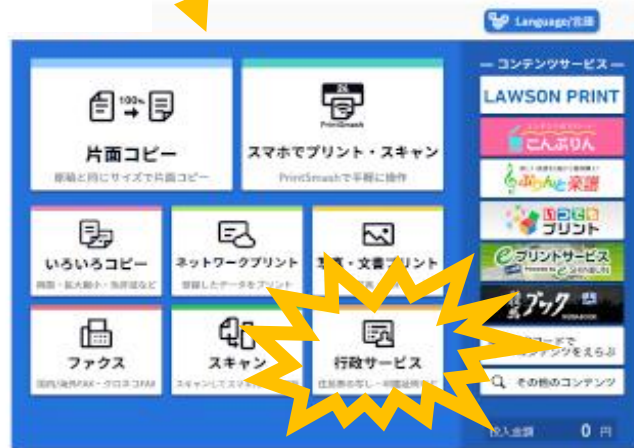
↑マルチコピー機の画面