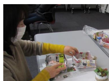
図書館講座 多肉植物の寄せ植え講座