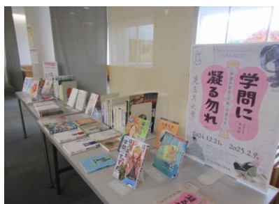
なかはくとのコラボ企画 学問に凝る勿れ

子どもの読書活動を推進するため、旧中津市、三光管内の幼稚園・保育所・保育園・こども園を対象に、耶馬溪図書館移転に伴い除籍した絵本の無償譲渡会を開催しました。