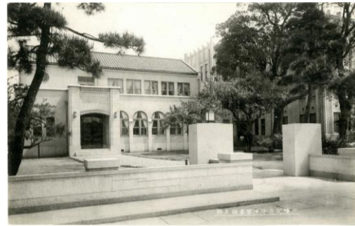
移転前の図書館 (現在の新中津市学校)