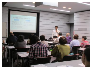
図書館講座 あなたにとっての“終活”考えてみませんか?