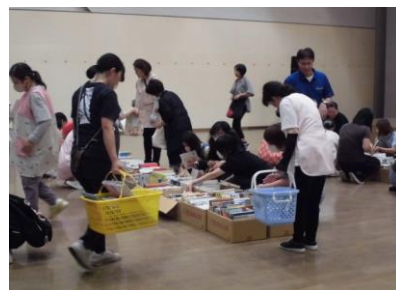
除籍に伴う絵本無償譲渡会