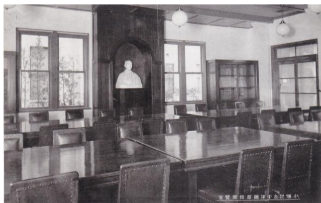
移転前の図書館 閲覧室 （現在の新中津市学校）