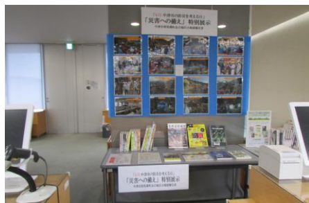
市防災危機管理課とのコラボ企画 4.11中津市の防災を考える日