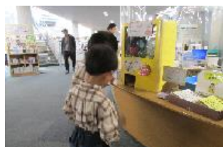
こどもの読書週間 ガチャ本

市内小学生を対象に夏休みイベントとして夏の工作教室を行いました。小幡記念図書館では、「『おすし』を作ってみんなで遊ぼう」を、各分館では「夏休みPOP制作」や「ソーマトロップをつくろう」、「ふしぎなアルミたまごをつくろう!」、「紙コップUFOをとばそう! マジックハンドを作ろう!」など工作をとおして、楽しみながら本にふれあうきっかけづくりを行いました。