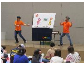
読書週間 秋のおたのしみおはなし会 『DANパネ団パネルシアター』