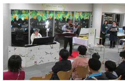
図書館コンサート