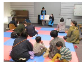
R5認定子ども司書によるおはなし会