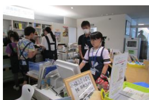
R6子ども司書養成講座