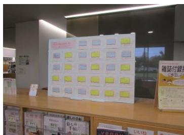
読書週間 わたしの『お気に入りのこの一行』

利用者の貸出の多い分類のものなどからテーマを決めて「野菜づくりのコツと裏技講座2024」「新NISA初心者向け講座」「あなたにとっての“終活”考えてみませんか?」「多肉植物の寄せ植え講座」の4つの講座を企画し、どの講座も大変好評でした。会場に関連図書の展示を行い、貸出につなげる工夫も行いました。