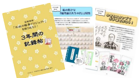
不滅の福澤プロジェクト 3年間の記録帖