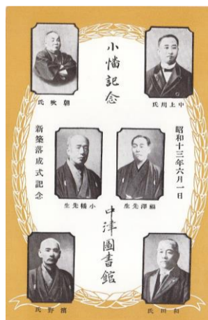
移転前の図書館 新築落成式記念カード