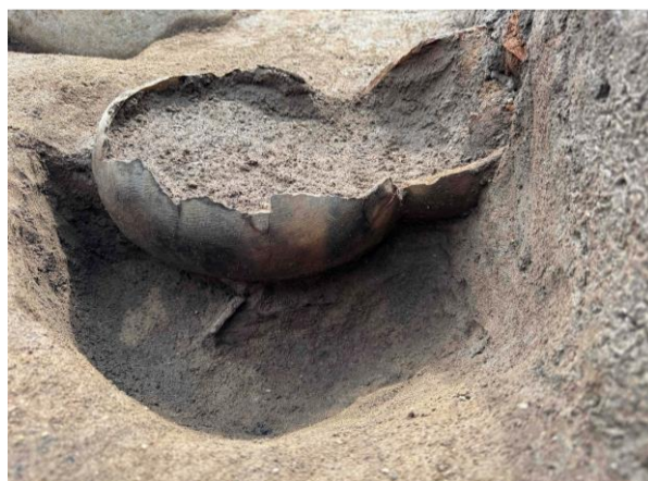
古戸遺跡・甕棺墓