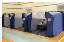
避難所体験 イメージ