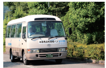
[本耶馬溪コミュニティバス]

* 旧下毛地域を対象に移住施策を進めるにあたり、課題となっている仕事の確保についてサテライトオフィスやテレワーク等を推進する経費。働く場所を限定しない在宅勤務等の普及を図ることで、子の看護等による離職を防ぎ、子育て世代を中心に仕事の確保及び働き手の確保が可能となる。