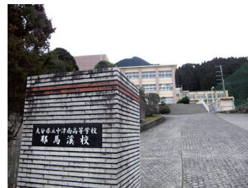
[中津南高校耶馬溪校]