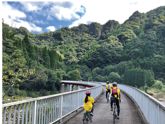
[サイクリングイベント]