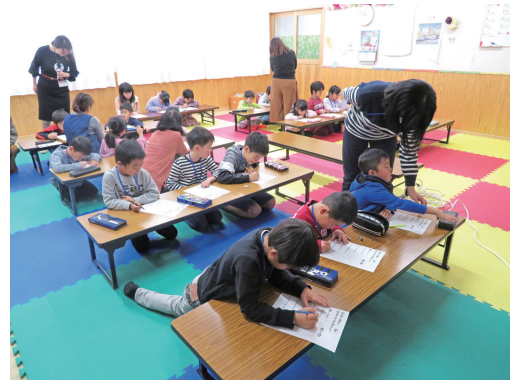
[児童クラブの様子]

* 令和2年度に放課後児童クラブの待機児童が発生する見込みの市中心部において、県総合庁舎を活用し、臨時的に放課後児童クラブを開設するための経費。また、近年急増するニーズに応じ、夏季休業期間限定の児童クラブも同施設を活用して実施することで、共働き世帯の支援や子どもたちへの適切な遊びや生活の場を提供し、健全な育成を図ります。