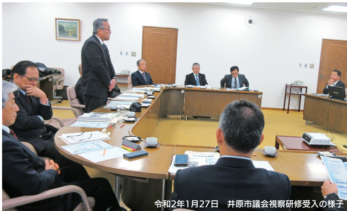
令和2年1月27日 井原市議会視察研修受入の様子