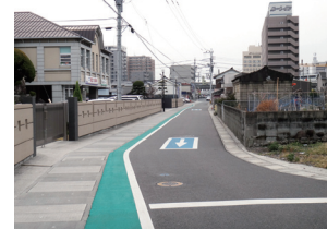
[通学路整備(グリーンベルト)]