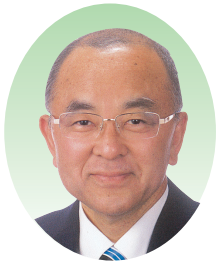
三上 英範 (日本共産党)