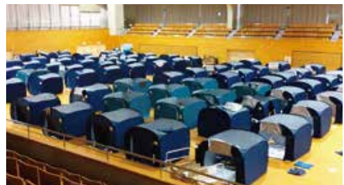
避難所（ダイハツ九州アリーナ）の様子

答 市職員も含めた市民の防災意識の向上を図ると共に、共助の土台となる自主防災組織の横の連携の更なる強化や、地域福祉ネットワーク協議会などの各地域の中心となる組織との協働について、これまで以上に積極的に取り組んでいきたいと考えております。また、災害時の避難行動として、安全な場所にいる場合は避難する必要はないこと、避難所だけが避難先ではなく、安全な地域に居住する親戚や知人宅への避難も検討するよう、ホームページや防災出前講座などを通じて周知しているところです。さらに、市民の皆様にも早めの避難行動をお願いするため、屋外放送による避難情報発信のほか、なかつメールや告知端末、防災FMラジオ、河川カメラの映像配信などを通じて、必要とする人に確実に届けられるよう、情報発信の多重化に努めており、今後も引き続き、情報発信の体制充実に向け取り組んで参ります。