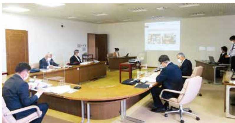
茨城県つくば市議会（6次産業商品の認定制度について）

令和4年度は「議会改革の取り組み」や「6次産業の認定制度」、また「中学校のブレザー型標準服（制服）の導入」などをテーマに、これまで9議会、延べ60人の視察研修の受け入れを感染対策を講じた上で行いました。