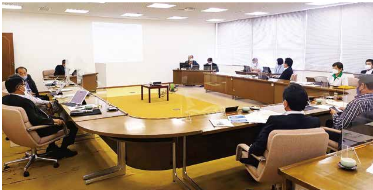
茨城県神栖市議会（議会改革の取り組みについて）

中津市議会では、新型コロナウイルス感染症の感染状況を注視しながら、他議会からの視察研修の受け入れを積極的に行っています。