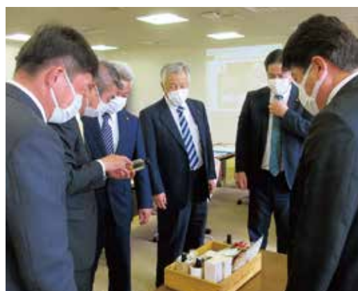
なかつ6次産業推奨品の説明