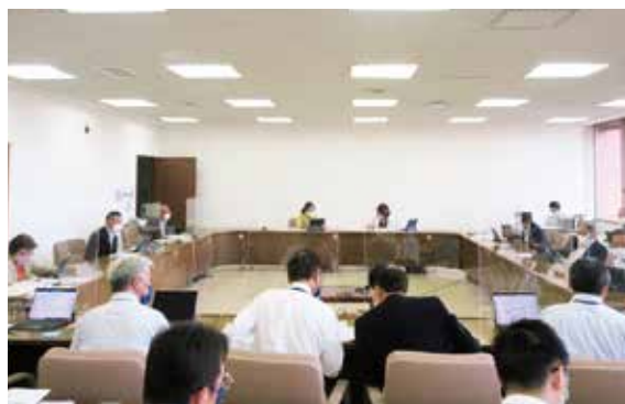
10月5日(水)・7日(金)厚生環境委員会