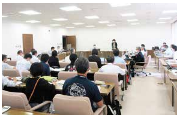
10月4日(火)教育産業建設委員会