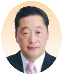
まつば たみお 松葉 民雄 (公明党)