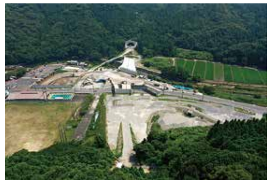
三光本耶馬溪道路 青の洞門・羅漢寺IC 付近

答 三光本耶馬溪道路のうち田口ICから青の洞門・羅漢寺IC間が令和5年度に開通予定となっており、全線開通に向け大きく前進しています。このICの開通により通勤・通学、買い物や娯楽のための移動時間が大幅に短縮され、またアクセス向上をPRすることで、広範な耶馬溪地域への観光客増が期待されます。こうした契機を地域の人々が地域活性化やビジネスチャンスとして捉え、活用しようとするのが何より大切だと考えます。市においても、IC開通を見据え「道の駅耶馬トピア」の大規模なりニューアル事業、青の洞門対岸での公共駐車場整備事業に取り組んでいます。