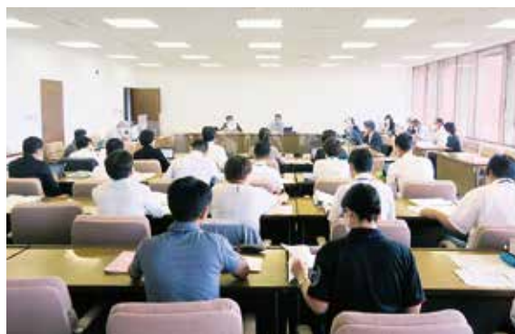
10月3日(月)総務企画消防委員会

令和4年10月3日・4日・5日・7日、令和3年度中に執行した事業等の決算審査を行いました。