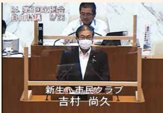
(補足説明者:吉村尚久議員)