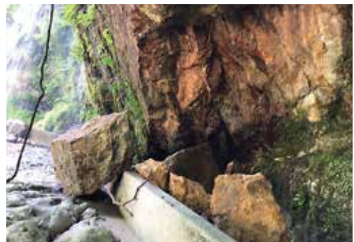
明治44年にできた中山間地域の水路 岩が崩れ落ち、重機が入らず、使用不可に。

答 現在、国は農業経営の安定に向け、地域の特性を活かした産地づくりを推進するための「経営所得安定対策事業」を充実させ、産地交付金の対象を拡大しており、市としても、既に「水田収益力強化ビジョン」を策定し取り組みを行っています。農業用水路の維持管理は、農業者の高齢化や少子化が進むなか、厳しくなっているのが現状だと認識しております。そこで、まずは、国の支援制度を積極的に活用し、今後は現状を踏まえ地域にあった取り組みを考え、土砂撤去や樹木の伐採など人力ではできないような維持管理等については、地元関係者や水利関係者と協議を行い、必要な支援をしていきたいと考えております。