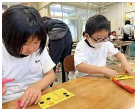
小学部図画工作の授業の様子