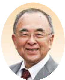
み かみ ひで のり 三上 英範 (日本共産党)