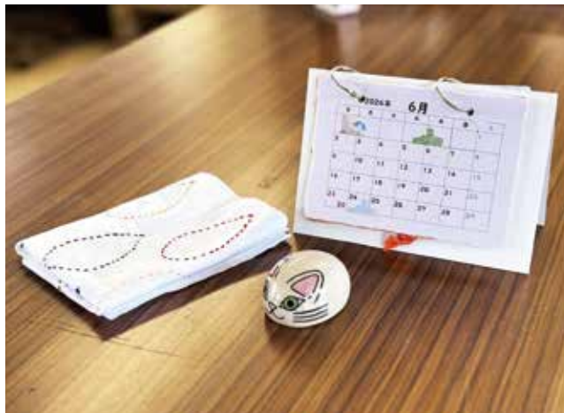
「職業」で制作した製品