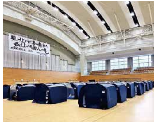
避難所運営の様子

答 防災学習について学校安全計画に則って、火災避難訓練・地震避難訓練、不審者対策避難訓練等を防災危機管理課や消防署等の協力を得て行っており、回数は年2回以上実施しています。また、地域や各種団体を対象に防災出前講座や防災研修などの支援も行っています。支援がきっかけで、自主防災組織が主体となった、防災訓練の実施、避難所の運営支援、避難に支援が必要な方の援助計画に取り組みとする地域も現れています。このような好事例を、他の組織にも紹介し、少しずつできることから、地道に手順などを学んでいただき、定期的な訓練の実施と内容の充実が図られるよう、引き続き支援を行っていきます。