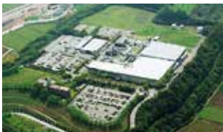
ルネサスエレクトロニクス㈱大分工場

多文化共生については、昨年12月より外国人総合相談センターを運営しており、体制拡充に努めています。また、「日本語教室の開催」や「各種情報の多言語化」、「日本語指導員の配置」などの対策に適宜取り組んでおり、部署間の連携はもちろん、国や県、関係団体とも連携を進めます。