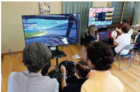
eスポーツ体験会の様子

答 リズムに合わせて太鼓を叩くゲームなどのeスポーツは、様々なコンテンツがあり、性別や社交性に関係なくでき、認知症予防やフレイル予防に効果が期待できるといわれています。さらに、eスポーツ体験会や対戦イベントの開催により、通いの場等にこれまで参加されなかった高齢者の方々の参加を促進できることから、今年度、大分県の「通いの場魅力向上事業」を活用して「元気いきいき☆週一体操教室」の1か所において、eスポーツを取り入れたモデル事業を実施いたします。