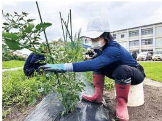
高等部農業班の収穫の様子