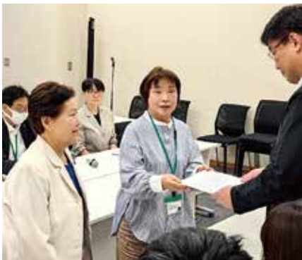
政府関係者へ個人情報保護についての要望書提出

答 令和6年度は18歳、22歳のあわせて1,452人の氏名、性別、住所、生年月日の情報を提供しました。自衛隊への情報提供を望まない方もおられるので除外申請制度を設け、市ホームページで周知しています。名簿は自衛隊募集業務のみに使用されます。