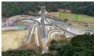
青の洞門・羅漢寺IC付近