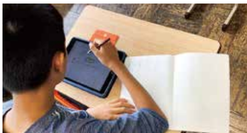
学校でのICT活用の様子

答 複式学級では、旧市内と同様のペア・グループ学習が難しいところではICTの活用や他校との合同学習などにより、主体的な学びに繋げています。次に、子ども同士の触れ合いによる社会性の涵養（かんよう）についてですが、地域や他校との連携を行っています。しかし、1校当たり学級数が1から5学級の「過小規模校」の現状等に鑑み、教育環境面から少子化等に対応した教育活動のあり方について考えていく必要があると考え、8月19日に「学校のあり方検討委員会」を設置しました。構成員は、学識経験者2名、学校代表2名、保護者代表5名、地域代表2名の11名です。同日、第1回の会議を開き、来年5月を目途に会議を重ね検討して頂き、報告書を提出して頂くことにしています。