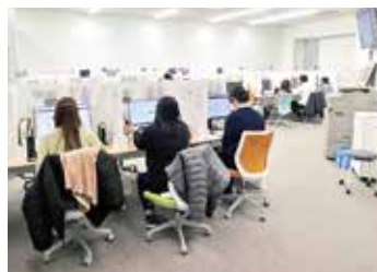
イオンモール三光内にある*BPOセンターで働く女性の様子