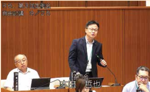
(補足説明者：本田哲也議員)