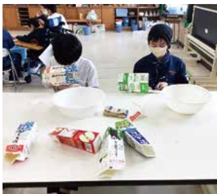
中学部紙工班の作業の様子