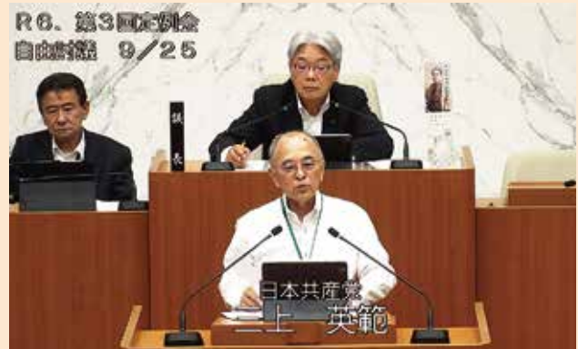
(補足説明者：三上英範議員)