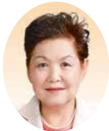
あらい ひろこ 荒木 ひろ子 (日本共産党)