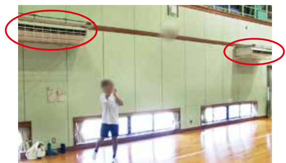
エアコンがついている中津東体育館

防災ラジオは希望者に配布しています。貸与したラジオが聞こえない場合は、防災危機管理課へ相談していただきたいと思います。地域住民が主体となって運営する自主避難所は、自治会に対し必要な資機材等購入費用を補助金として支援しています。