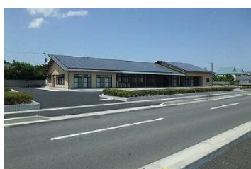
コミュニティーセンター