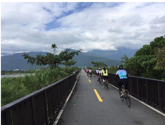
サイクリングの様子

※ 花博とは、2018年台中フローラ世界博覧会のことで、花や庭園をテーマにした国際的な博覧会です。