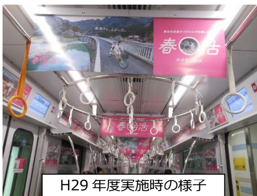
H29年度実施時の様子

前回（平成30年2月）は“筑肥線・福岡市営地下鉄相互乗入れJR車両”で実施。今年はより博多駅～天神区間の便数が多い路線で、夏休みのファミリーや出勤、帰宅の社会人の方に、やばけいキャンプなど「夏の耶馬溪の過ごし方」