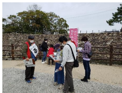
歴史クイズに挑戦