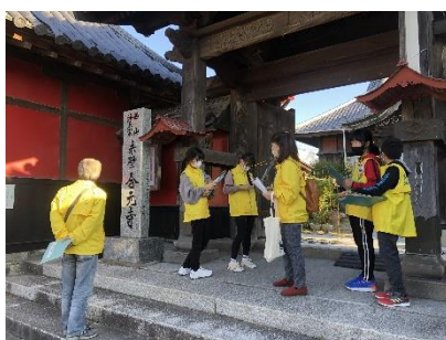
昨年度の現地リハーサル