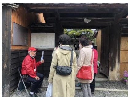
ベテラン観光ガイドの説明