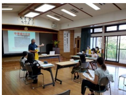
子供達は10月から勉強しています