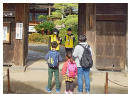
昨年度の本番の様子。緊張してる？