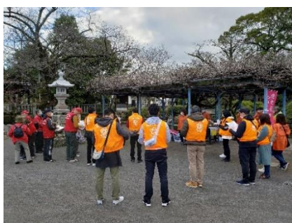
南部まちおこし講座（地元住民）と地域の企業の皆さんと一緒にしています